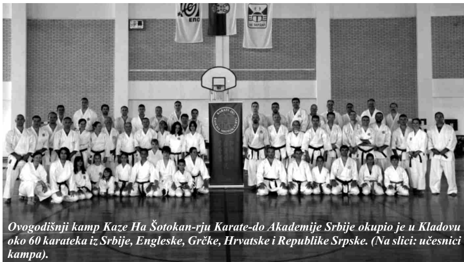
Ovogodišnji kamp Kase Ha Šotokan-ryu Karate-do Akademije Srbije okupio je u Kladovu oko 60 karateka iz Srbije, Engleske, Grčke, Hrvatske i Republike Srpske. (Na slici: učesnici kampa).